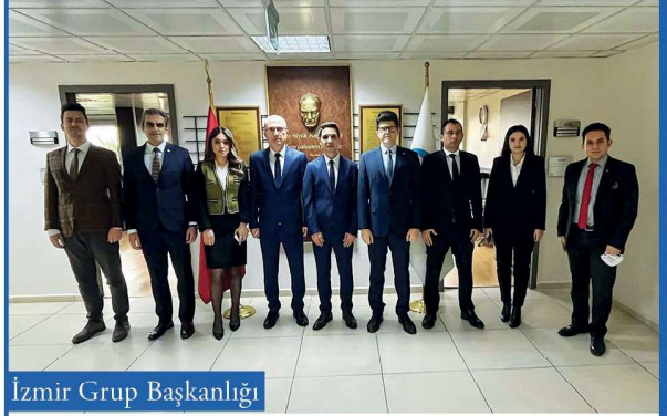
İzmir Grup Başkanlığı

Üç yıllık yetiştirme döneminin ardından yapılan yeterlik sınavında başarılı olarak müfettişliğe atanan 12. dönem meslektaşlarımızı tebrik ederiz.