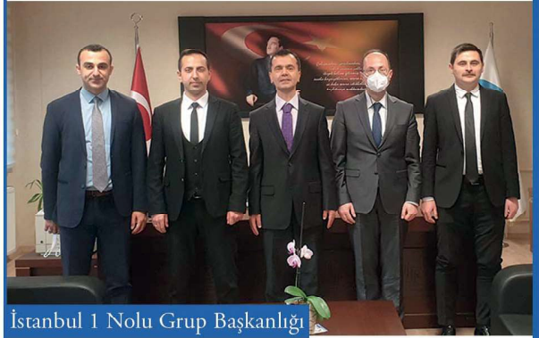
İstanbul 1 Nolu Grup Başkanlığı