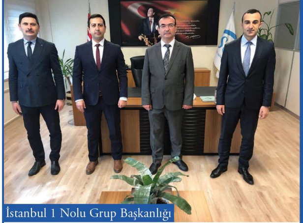
İstanbul 1 Nolu Grup Başkanlığı