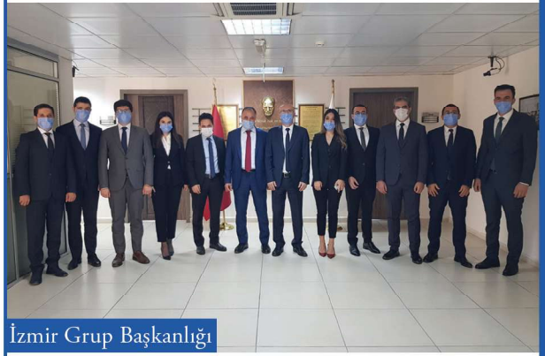
İzmir Grup Başkanlığı

10/09/2020 tarihinde girmiş oldukları yetki sınavında başarılı olarak müfettişlik mühürlerini almaya hak kazanan 12. dönem Müfettiş Yardımcısı meslektaşlarımızı tebrik ederiz.