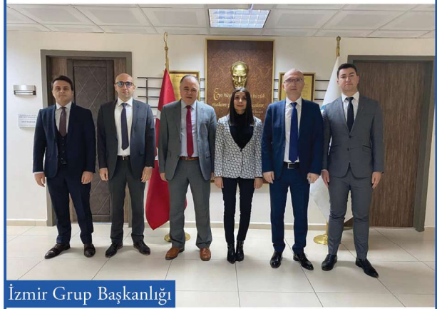
İzmir Grup Başkanlığı

05/11/2020 tarihinde yazılı, 03/12/2020 tarihinde sözlü bölümü gerçekleştirilen yeterlik sınavında başarılı olarak müfettişliğe atanan 11. dönem meslektaşlarımızı tebrik ederiz.