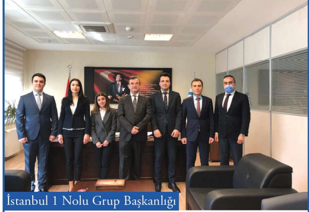
İstanbul 1 Nolu Grup Başkanlığı